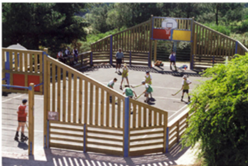
Multi-Sports ADO-MIRA 27 x 12

Vue des travaux réalisés pour : la Communauté de Communes du Pays de Guéméné-Penfao (44)